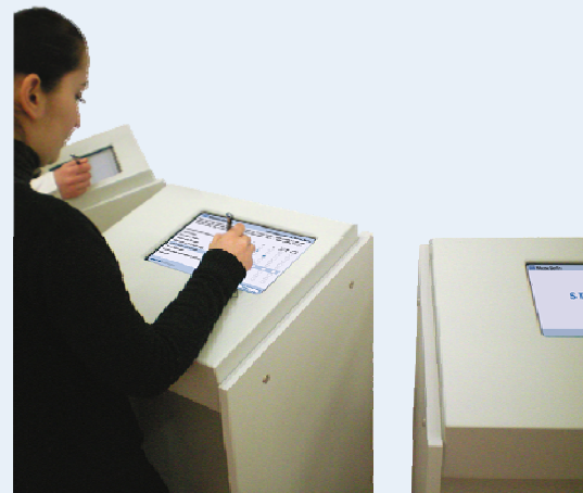
CASI-Terminals von Hopp & Partner im Einsatz